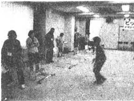
リングボールを楽しみましょう!